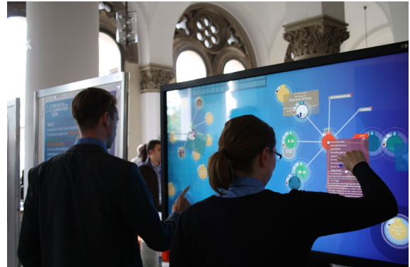
Abb. 1 Einsatz von CommunityMirrors als Informationsstrahler im halböffentlichen Raum – während der Tagung MuC 2014 an der LMU in München

Eine Möglichkeit, die Sichtbarkeit von Informationen zu erhöhen und die Kommunikation über und mithilfe von Informationspartikeln im soziokulturellen Kontext zu fördern, ist die Nutzung von interaktiven Großbildschirmen im öffentlichen oder halböffentlichen Raum. Als interaktive Informationsstrahler können Bildschirme Informationen für einzelne Nutzer oder Gruppen anzeigen, nach denen nicht aktiv gesucht wird, und durch eine Interaktion