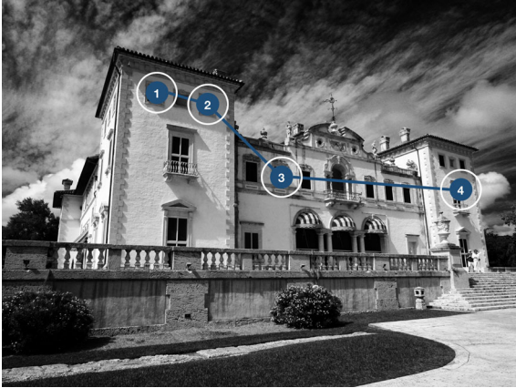
Abb. 4 Beispiel für ein grafisches Passwort, bestehend aus vier Passwortpunkten, welche auf Objekten in Bildern definiert werden (hier: die Fenster eines Gebäudes)

merziellen Systeme, Picture Passwords, wurde mit Windows 8 1 eingeführt.